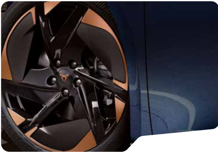
→ 20" BLIZZARD T