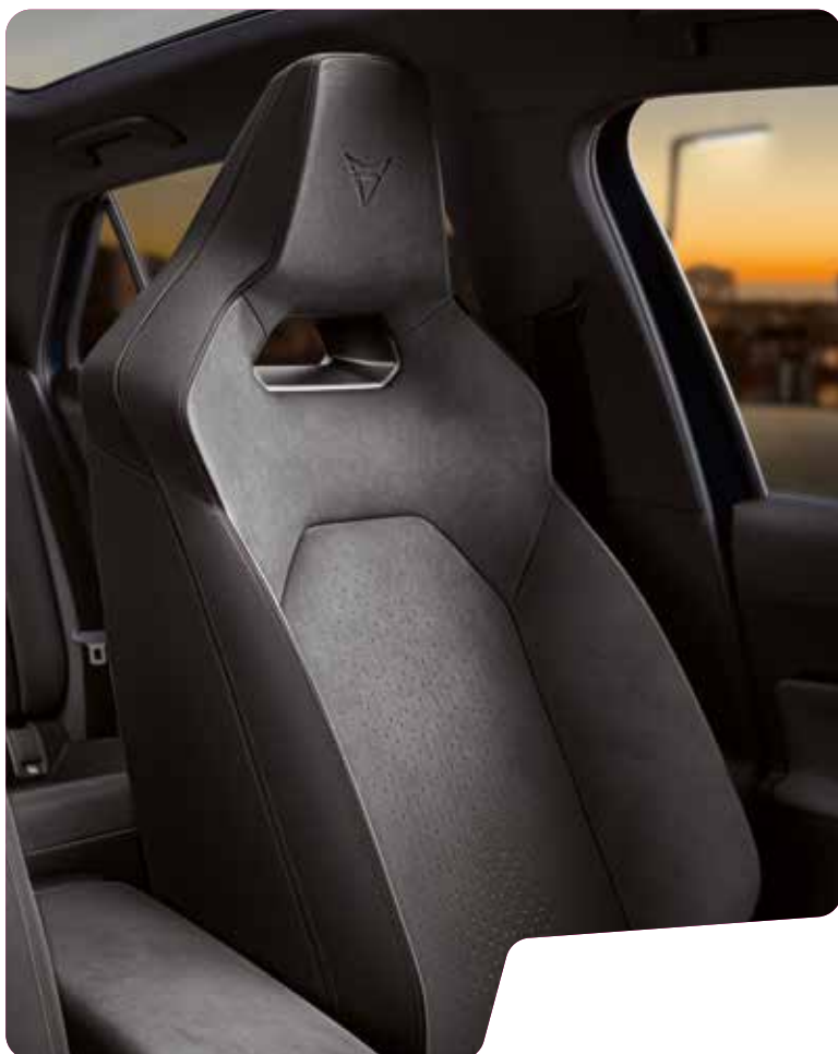
← DINAMICA® GRANITE GREY SKÅLADE SPORTSTOLAR 7