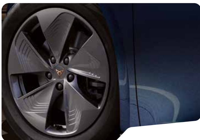
↑ 18" CYCLONE S