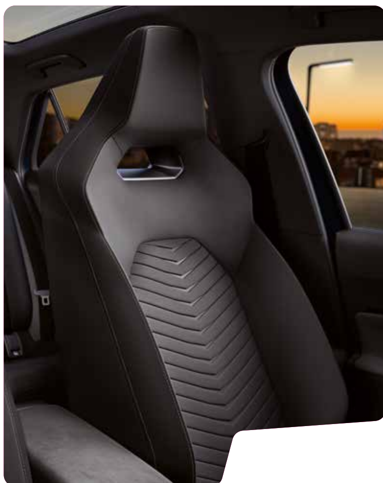
→ SEAQUAL® SKÅLADE SPORTSTOLAR 5