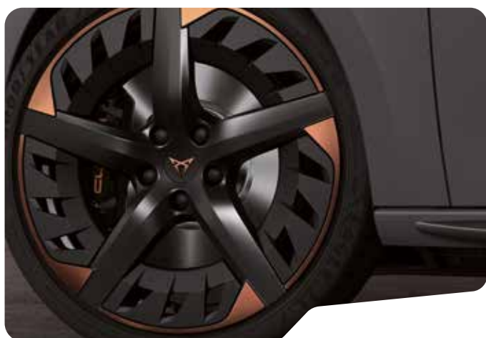
↓ 19" AERO SPORT BLACK OCH COPPER 1 P8W VZ