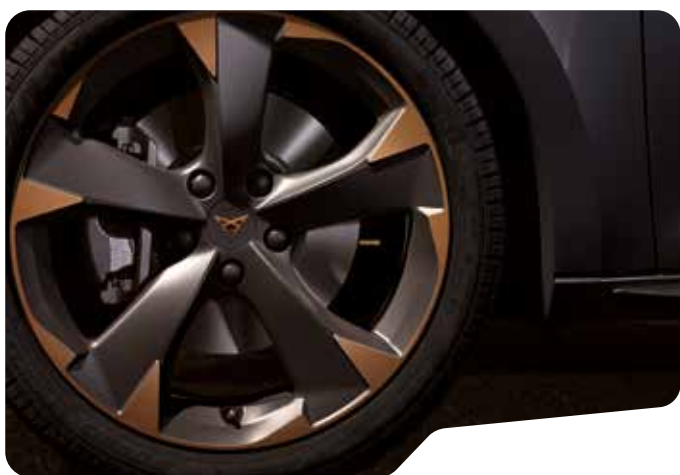
↑ 18" LÄTTMETALLFÄLGAR SPORT BLACK OCH COPPER* PT2 L