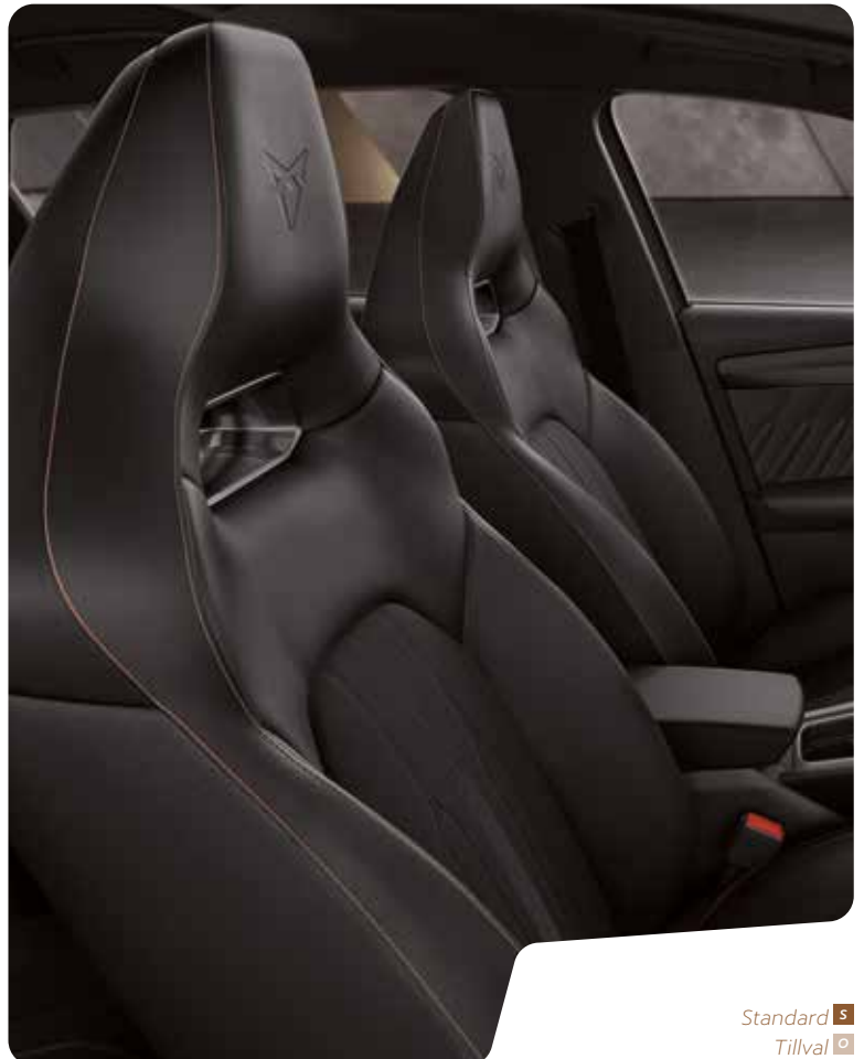
→ SKÅLADE SÄTEN I TYGET SHARP VZ L