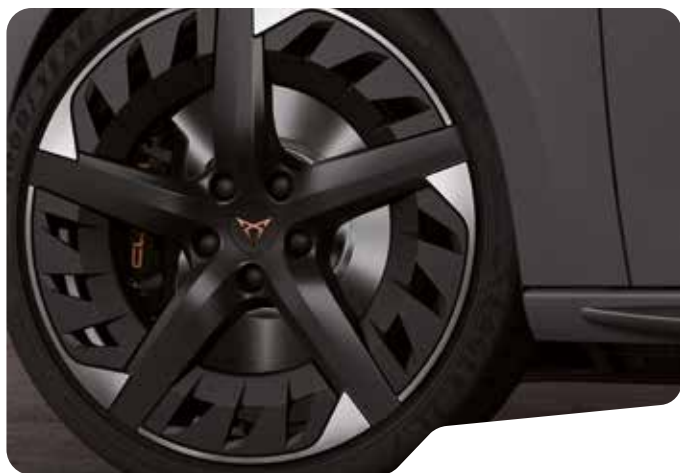
↑ 19" PERFORMANCE SPORT BLACK OCH COPPER PYA VZ CUP VZ