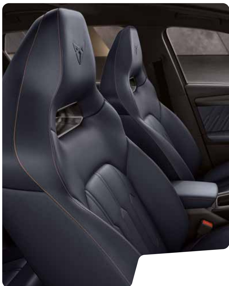
→ SKÅLADE SÄTEN I ÄKTA LÄDER I PETROL BLUE L VZ