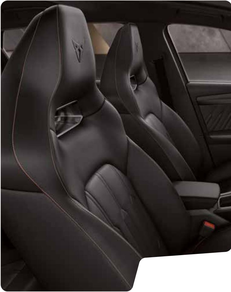
← SKÅLADE SÄTEN I ÄKTA LÄDER I BLACK L VZ