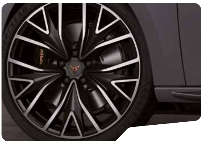
↑ 19" PERFORMANCE SPORT BLACK OCH SILVER PYB VZ