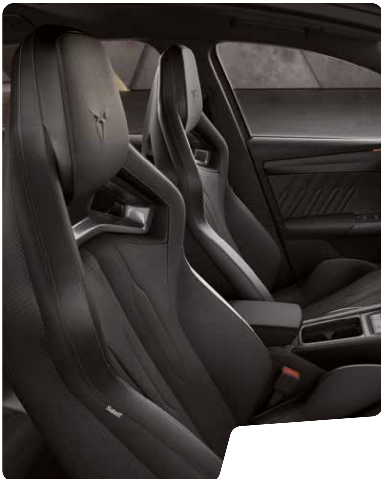
← SKÅLADE SÄTEN I ÄKTA LÄDER BLACK 1 VZ CUP