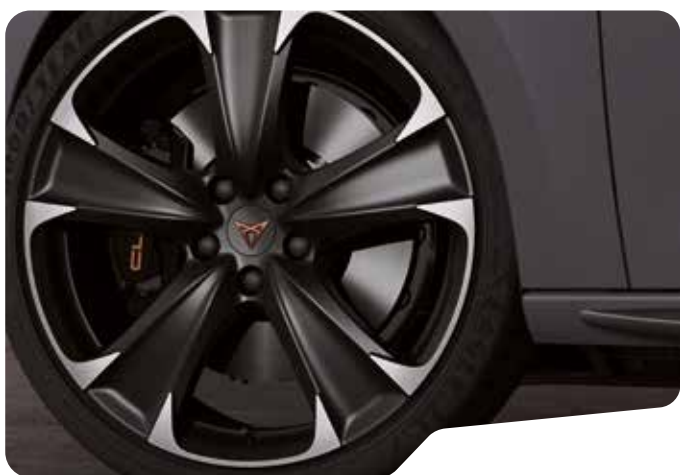
→ 19" LÄTTMETALLFÄLGAR SPORT BLACK OCH SILVER VZ