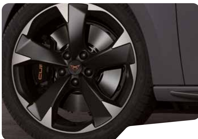
↓ 18" LÄTTMETALLFÄLGAR SPORT BLACK OCH SILVER L

*18" lättmetallfälgar i Sport Black och Copper. Ingår i designpaket som omfattar Svart takspoiler, Mörka aluminium pedaler och svart innertak.